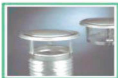
Regendach (KA-RD) Regendach mit Funkenfänger (KA-FF)

Der patentierte Saugkopf sorgt für optimalen Zug bei ungünstigen Windverhältnissen. Durch die Schrägstellung der Kiemen wird die Luft nach oben abgeleitet, wodurch im Kaminrohr Sogwirkung entsteht und die anfallenden Rauchgase besser entweichen.